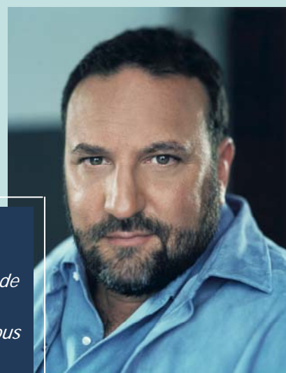
DARK CASTLE Joel Silver Producteur, Hollywood